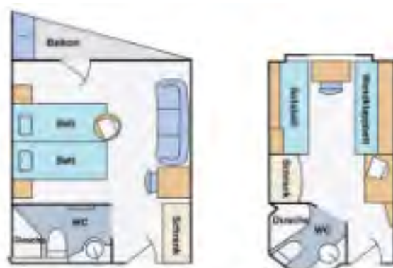
Kabinen 16,5 m 2 und 11,5 m 2